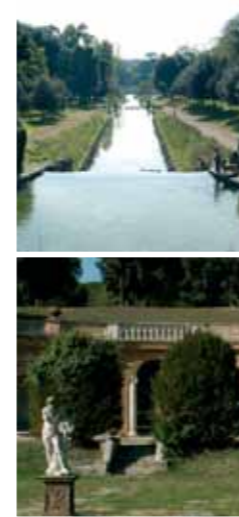
Casa del Cinema